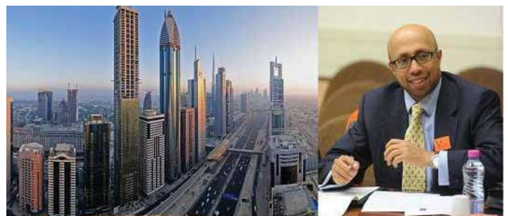
The Gulf and Regional Balance in the Middle East: Challenges and Perspectives

2. Πραγματοποιήθηκε στις 10 Απριλίου 2021 διαδικτυακή ομιλία του του Δρ. Abdullah Baabood με θέμα: «The Gulf and Regional Balance in the Middle East: Challenges and Perspectives». Η ομιλία και συζήτηση διεξήχθη στην αγγλική γλώσσα.