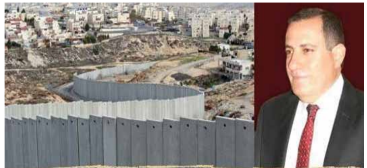
Regional Balance in the Middle East and the Palestinian Question

1. Πραγματοποιήθηκε στις 22 Μαρτίου 2021 διαδικτυακή ομιλία του Δρ. Ahmad Jamil Azem, member of the PLO Palestinian Central Council, and Chief Editor of the PLO Journal Shuun Falistaniyyah (Palestinian Affairs), με θέμα: «Regional balance in the Middle East and the Palestinian Question». Η ομιλία και συζήτηση διεξήχθη στην αγγλική γλώσσα.